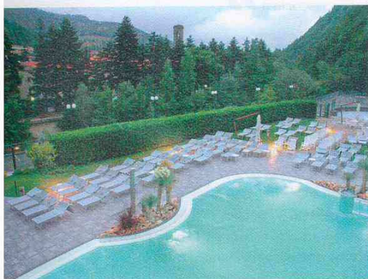
Il Ròseo Euroterme di Bagno di Romagna (FC) offre piscina, Spa e centro fitness.

Prezzo: doppia b&b da 190 euro. Sono inclusi: percorso etrusco, ingresso alle piscine