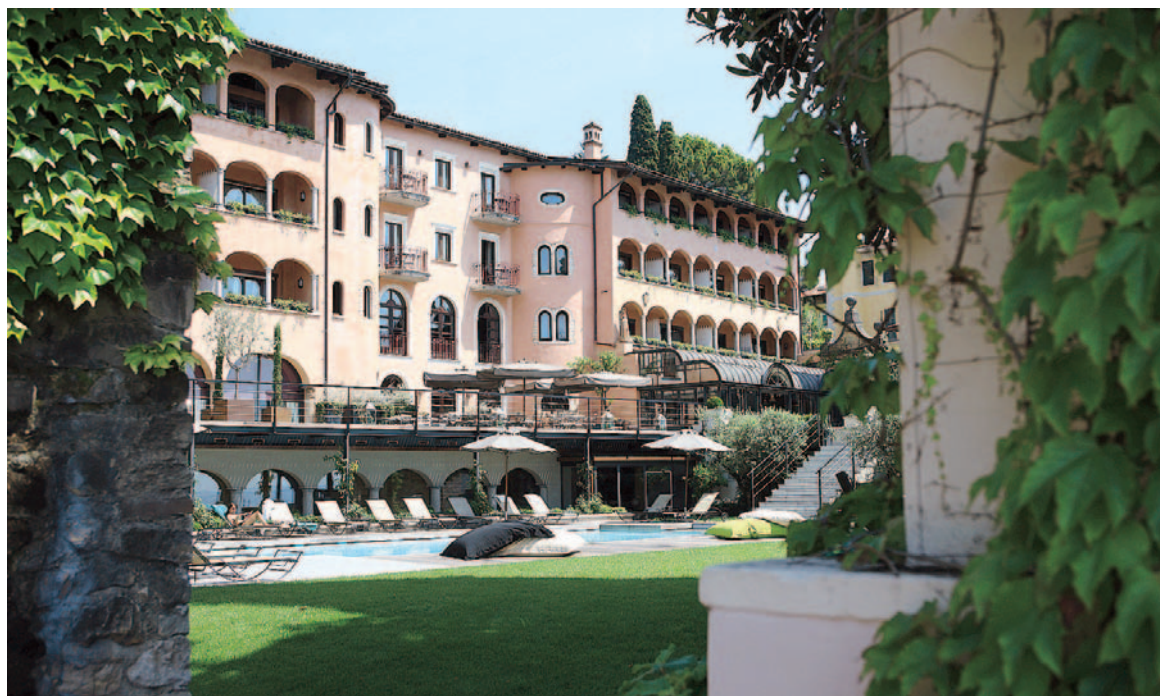
RELAX La piscina di Villa Paradiso nel parco affacciato sul lago

Info: www.villaparadiso.com ; info@villaparadiso.com , numero di telefono 0365.294811.